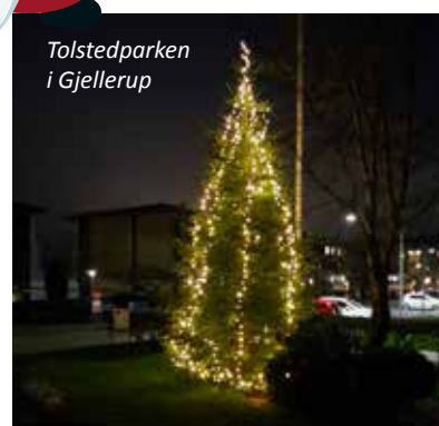
Tolstedparken i Gjellerup